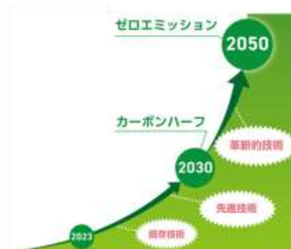
ゼロエミッション実現に向けたビジョン