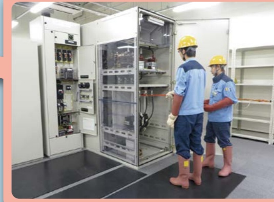
電気保安点検用配電設備

実際の施設を再現した監視室で、ポンプ所施設の運転操作や故障対応など、施設の運転管理の技術を習得できます。