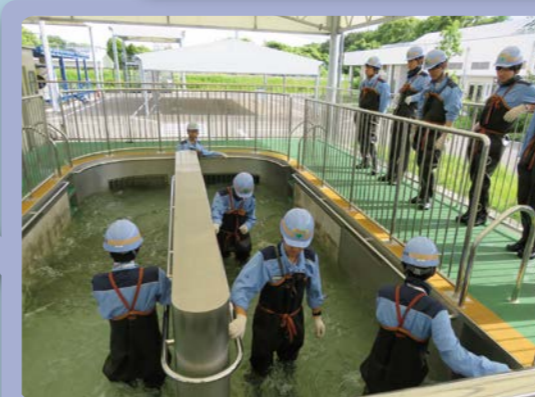
管路内水中歩行モデル

実際に現場に設置されている人孔・管路を再現し、入坑するときの安全対策などを習得できます。