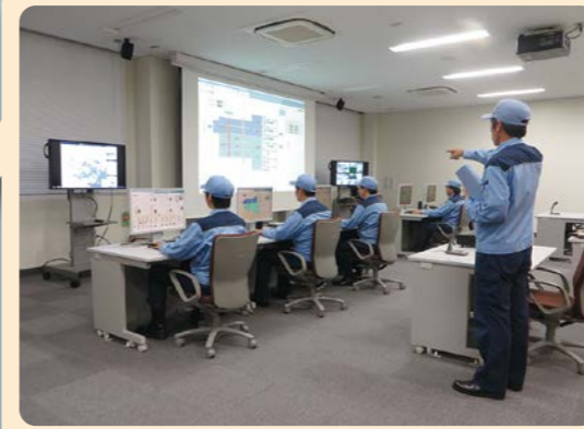
運転シミュレーション設備

実際の施設を再現した監視室で、ポンプ所施設の運転操作や故障対応など、施設の運転管理の技術を習得できます。