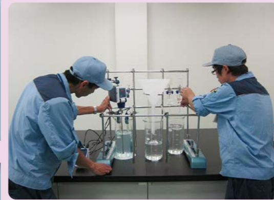
事業場排水処理実験装置

水処理プラントに設置されているものと同じ高低圧配電盤を利用し、電気設備機器の操作・点検及び各種試験と保安用具の使い方を習得できます。