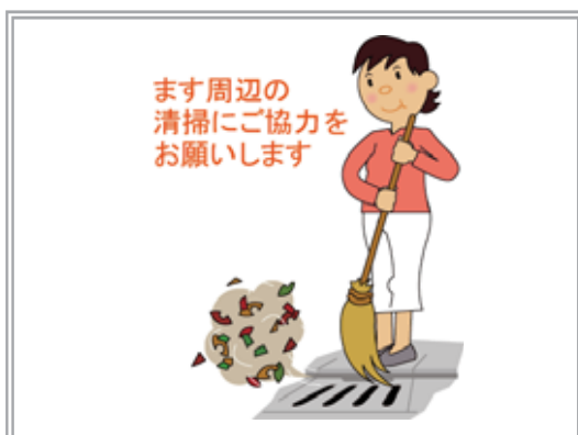
図3-12 道路雨水ます清掃の協力依頼