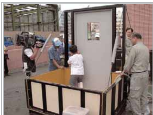
写真3-4 地下室浸水模型による避難体験