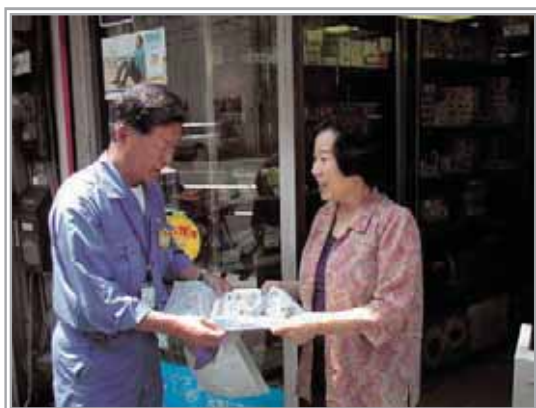
写真3-2 戸別訪問（リーフレット配布）