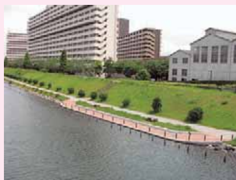
写真2-6 江東内部河川 (写真は旧中川)