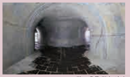
▲ 펌프 우물 접속 암거