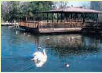
▲ 공원 내의 연못

미카와시마 물재생센터의 물처리시설 상부 공간을 아라카와구의 공원으로 개방하고 있습니다. 북쪽, 남쪽 합하여 61,100m 2 에 이르는 이 공원은 신 도쿄 백경에도 선정되었습니다. 또, 야구장, 테니스 코트 외에도 어린이 놀이터 코너와 교통공원 등도 있습니다.