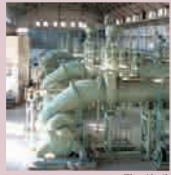
▲ 펌프실 내