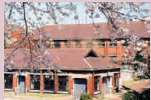
▲ 빗꽂기 시설

2013년 4월부터 일반 공개하고 있습니다. 견학은 예약제로 화·금·연말연시를 제외한 9:00~17:00. 03-6458-3940에서 접수하고 있습니다.