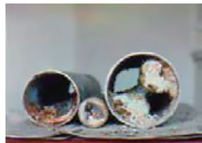
▼ 屋内排水管の 閉塞状況