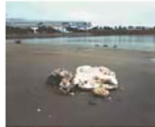
◀ 漂着した オイルボール

油を下水道に流すと下水道管で冷えて固まり、つまりや悪臭の原因になります。また、大雨が降ったとき、固まった油は、はがれてオイルボールとなり、川や海に流出し、水環境を汚してしまうことがあります。