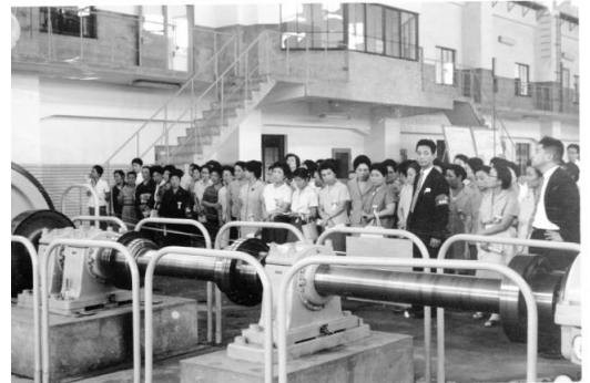
1963年9月 主婦の施設見学会 (三の橋ポンプ)